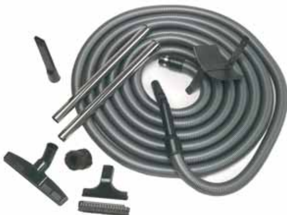
Das komplette Standardschlauchset