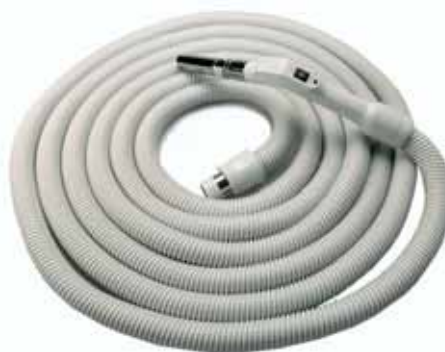
Der Komfortschlauch mit integriertem Ein/Ausschalter