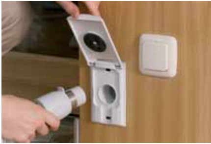
Deckel aufklappen ...