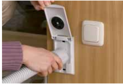
Schlauch anstecken ...