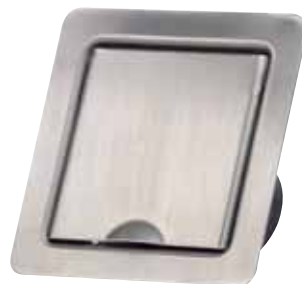
Fußbodendose aus Metall