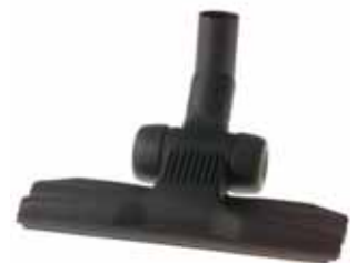
Universalbürste - vielseitig verwendbar