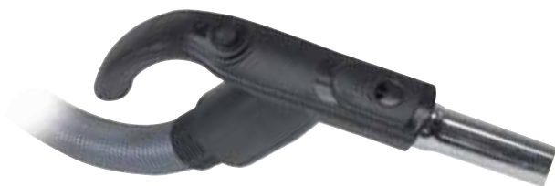
Der Ergogriff mit integriertem Ein/Ausschalter