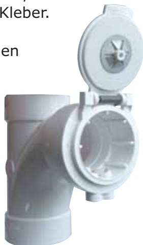
Rohrdose für Aufputzanwendung

Details und Informationen über die Montage von Saugdosen entnehmen Sie bitte der CrossVac „Installationsanleitung“.