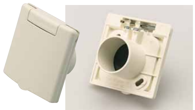
Saugdosenansicht von vorne u. hinten (VEX-S)