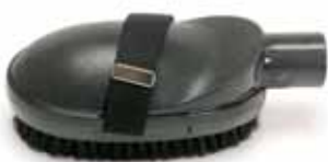
Tierstriegelbürste für große und kleine Vierbeiner