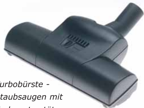
Turbobürste - Staubsaugen mit Turbounterstützung