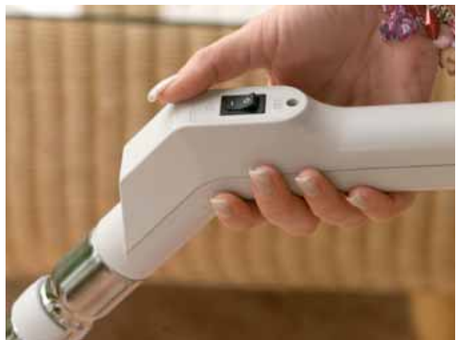
Der Schalter am Komfortschlauch ermöglicht die Inbetriebnahme der Anlage.