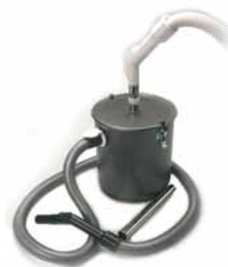
Ascheabscheider - für Kachelofen bzw. Bohr- und Stemmstaub