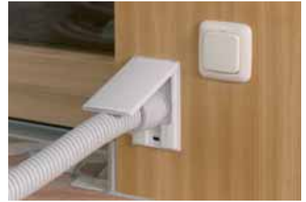
... fertig! Einfacher geht 's nicht!