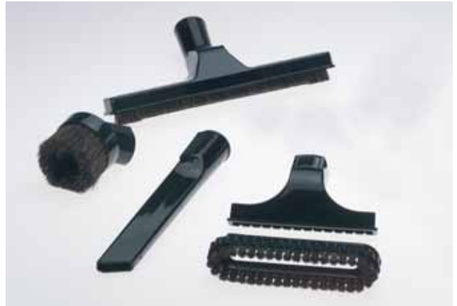
5-teiliges Bürstenset - die ideale Grundausrüstung

Weitere Informationen entnehmen Sie bitte unseren Produkt- und Preisauf- stellungen auf unseren Webseiten.