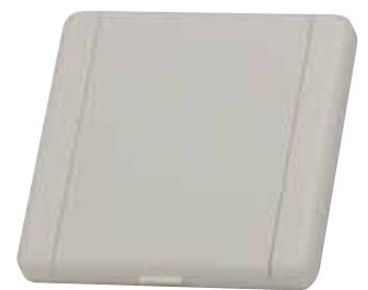
Saugdose VACUVALVE ES