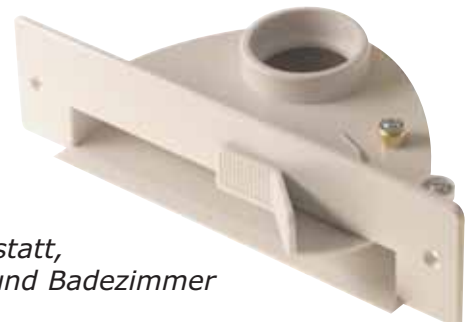
Kehrdose für Küche, Werkstatt, Hobbyraum und Badezimmer